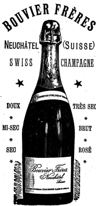
Se trouve dans tous les bons Hôtels suisses.

Café * Restaurant Kunsthalle am Steinenberg BASEL.