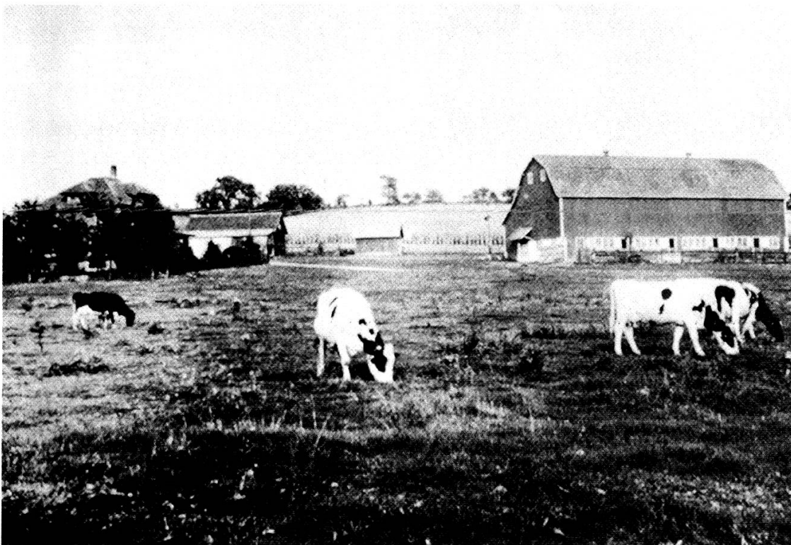
Die Kubly- oder Tell-Farm in New Glarus. Um 1940. (aus Herbert Kubly's «At Large»)