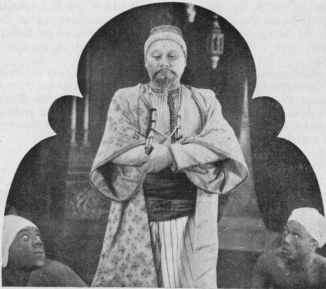
Paul Wegener als „Der alte Scheich“ in „Sumurun“.

Viele Gänge, viele Gemächer durchheilt er, immer vorsichtig, jeden Augenblick gewärtig, gefaßt zu werden. Da endlich erblickt er den jungen Scheich, der im Hofe des Harems gespannt ein erleuchtetes Fenster beobachtet. Die Tänzerin erscheint am Fenster und winkt ihn herauf. — —