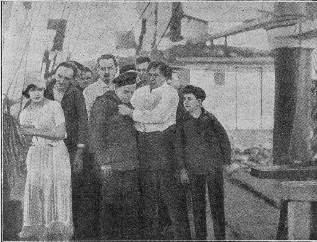
Szenenbild aus Steuermann folk.

mal und banne den Brand! Und der Wunderrabbi stieg auf die Höhe der Mauer und sprach den Feuerzauber und die Flamme erlosch.