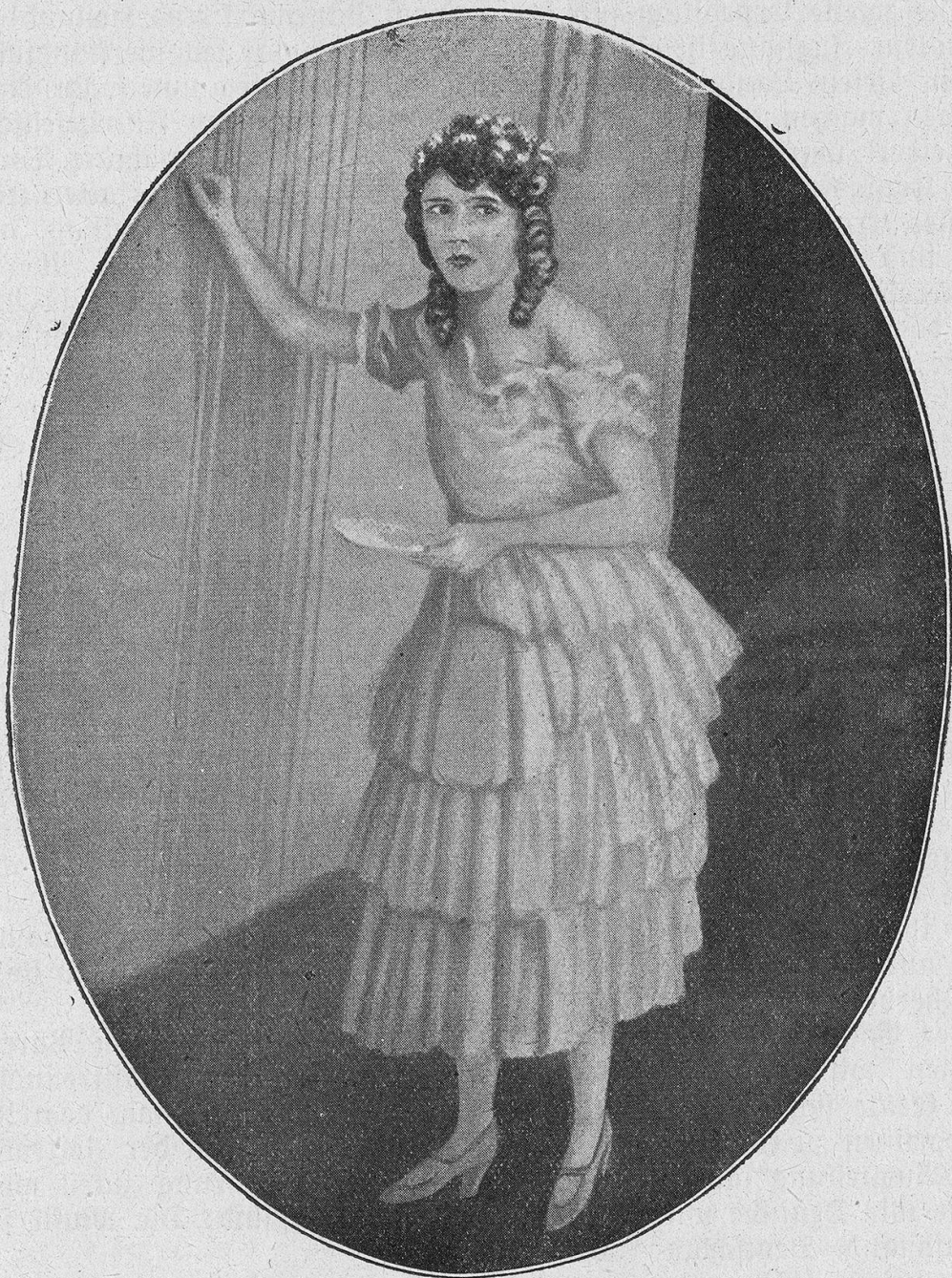
Mary Pickford die beliebte amerikanische Filmdarstellerin.