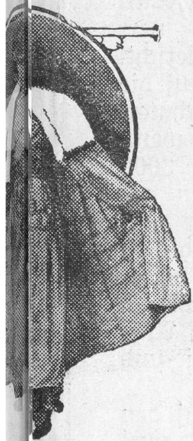
Abendtoilette aus ambergrauem Perfickerei, Hermelinpelz mit Gold- verschiedenfarbige Atlasrosen.