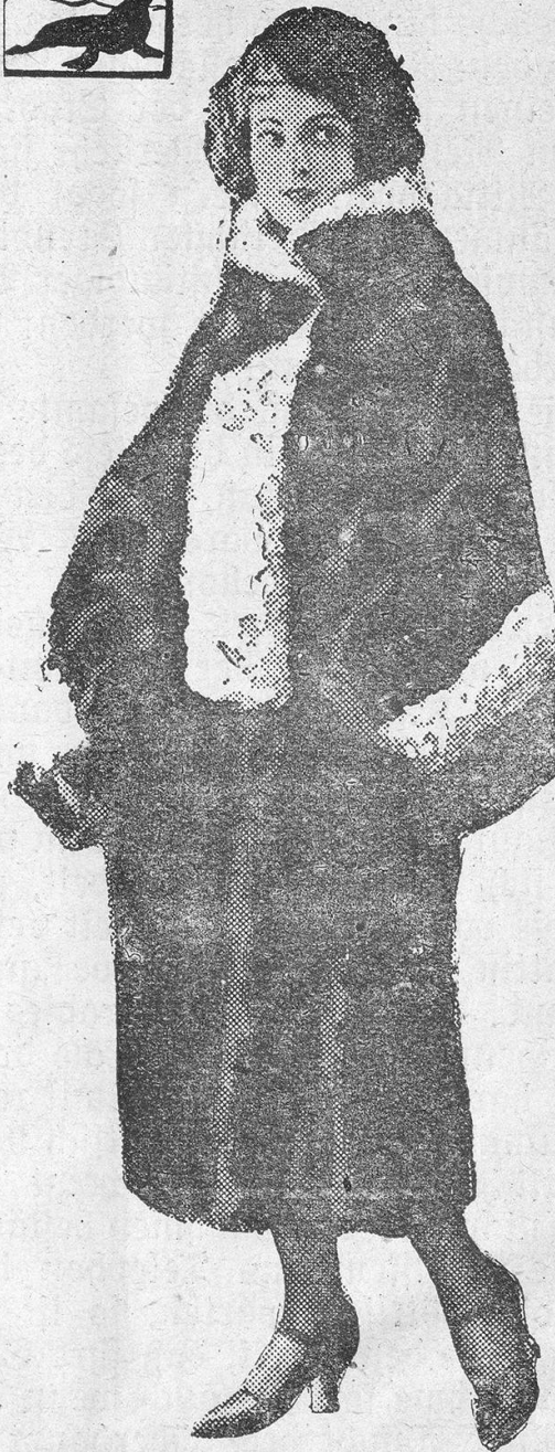
PRISCILLA DEAN, Universal-Star. Pelzmantel aus schwarzem Hudson-Seal mit Kragen aus grauer Wolle, schwarze Atlasschuhe und Chiffonstrümpfe.