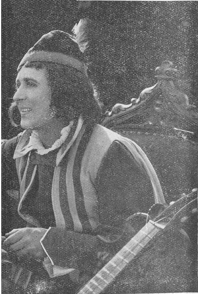
„Das Rad des Schicksals“ (La Roue) Hauptrolle.