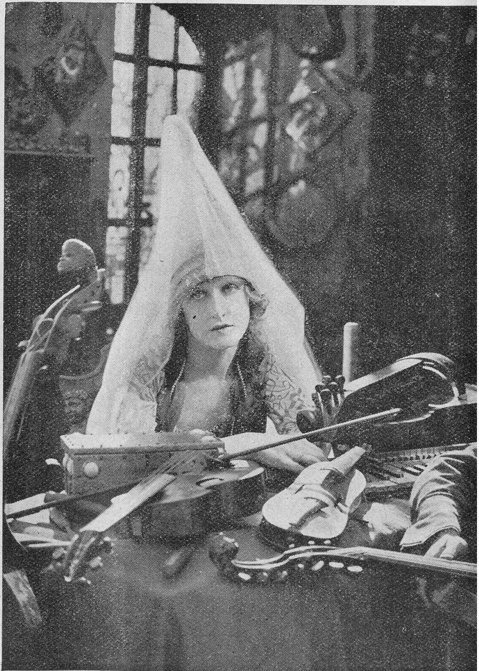
Szenenbilder aus dem neuesten Meisterwerk von Abel mit Séverin Mars in i