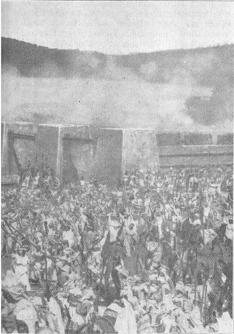
ng des trojanischen Pferdes in die Stadt.

Wehmütig stehen wir nun nach monatelanger ernster Arbeit und unendlichen Mühen vor den Trümmern des gewaltigen Troja. Niedergebrannt sind die Mauern, gebrochen die Säulen und gestürzt die Standbilder, rauchgeschwärzt ragen die Trümmer der Filmstadt in die stumme Luft, die sonst erfüllt war von erregendem Lärm der Kommandos, dem donnernden Gang der Licht- und Windmotoren, dem gellenden Geschrei der Komparsenmassen.