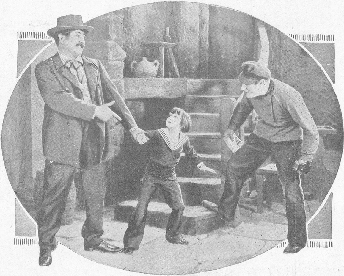
Jackie Coogan in seinem neuesten Film «Der kleine König».