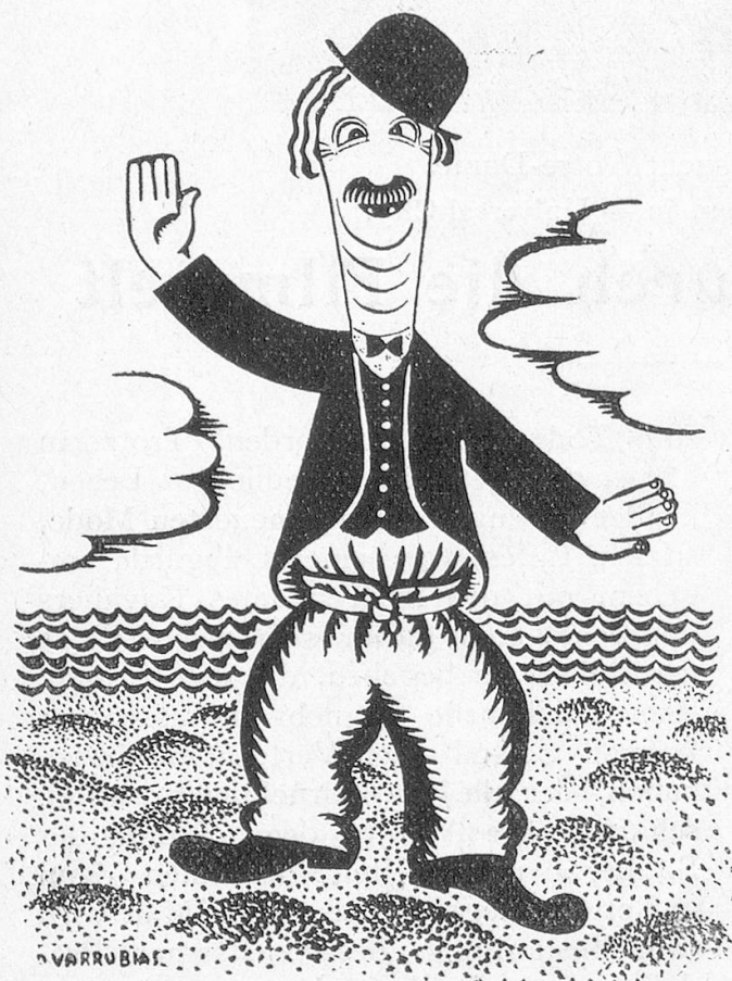
Die Karrikatur in der Karrikatur

1916 erhielt Ben Turpin, der sich glänzend entwickelt hatte, von Mack Sennett ein längeres Engagement und es entstanden dann in ununterbrochener Reihenfolge die vielen Ein- und Mehrakter, in denen er seine groteske, eigenartige Komik zur Geltung bringt, unterstützt von den hübschen Sennett-Badegirls, die (wer könnte sich da nicht berauschen !) durch ihre anmutigen Reize ein entzückendes Gegengewicht zu dem Tumult der Handlung bilden.