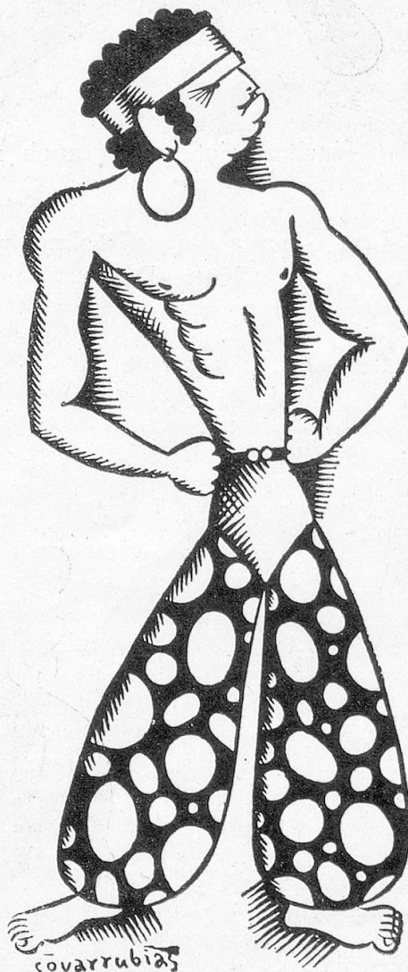
Zwei prächtige Karikaturen von COVARRUBIAS auf Ben Turpin und Douglas Fairbanks (als «Dieb von Bagdad»)