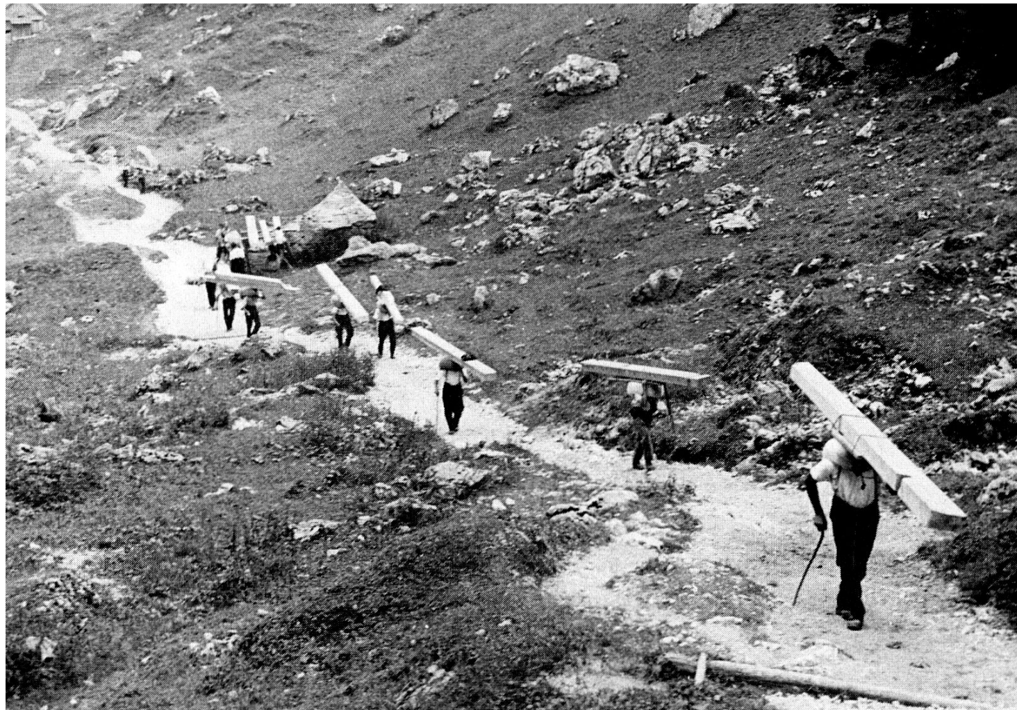
Die Träger setzen ihren Anstieg im Brülltobel fort.

te er von Fählen nach Schwendi. Damit keine Streue auf dem weiten Weg verloren ging, hat man die Burdenen wohlgeformt und allseitig «gschoppet». Der betagte, noch rüstige Mann erzählte mir mit erstaunlichem Gedächtnis seine Jugenderinnerungen: «Es gab jeweils gut zu essen und im Wagenschopf wurde Handorgelmusik gemacht. Mehr als zwei Stücke konnte der Musikant nicht spielen, und dennoch habe man es recht lustig gehabt.»