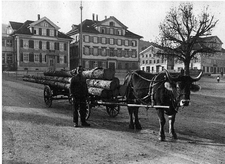
Ochsengespann auf dem Landsgemeindeplatz.

falls das nötige Kleingeld vorhanden war. Das Festhalten dieses Ereignisses lässt sich als seltener Ausdruck von Individualismus zu jener Zeit interpretieren.