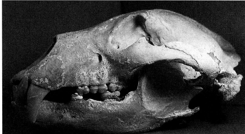
Schädel eines Braunbären. (Foto: Martin Fischer)