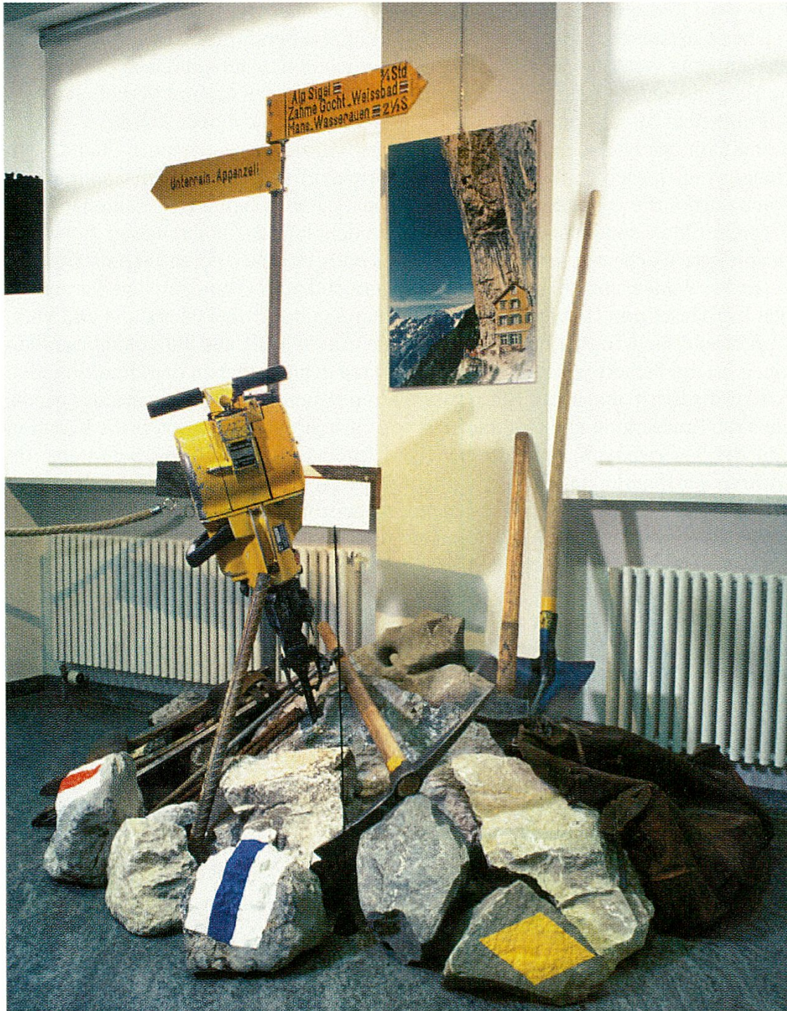
Blick in die Ausstellung «Vom Fremden zum Gast. 100 Jahre Kur- und Verkehrsverein Appenzell / Appenzellerland Tourismus AI».

zell und Umgebung den Kur- und Verkehrsverein Appenzell (KVA). Der Tourismus erfuhr in den letzten Jahrzehnten des 19. Jahrhunderts in Innerrhoden einen derart grossen Aufschwung, dass er zu einem der bedeutendsten Erwerbszweige wurde. Das Ländchen am Alpstein verdankt seine Attraktivität sicher einmal dem