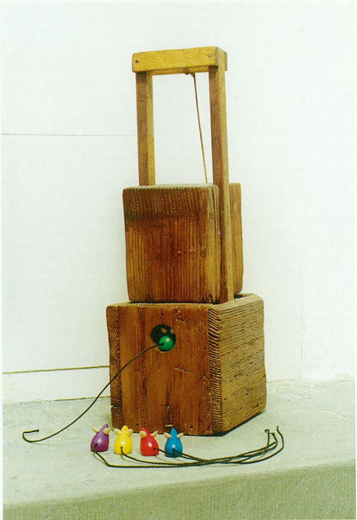
Schwerkraftfalle. Durch die Schwerkraft des Holzblockes werden die Mäuse erdrückt. Mausefallen-Sammlung Walter Krüsi.