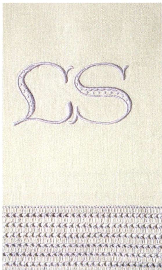
Besticktes Leintuch mit Hohlsaum und Initialen «LS».

Was die Brautleute, Frau und Mann, mit in die Ehe mitzubringen hatten, war regional unterschiedlich geregelt. In der Ostschweiz musste die Braut beziehungsweise der Brautvater fast für die ganze Aussteuer aufkommen. Ein wichtiger Bestandteil waren Bett-, Tisch- und