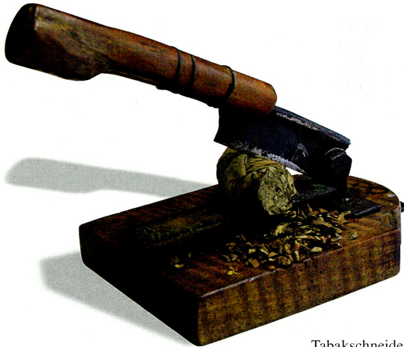
Tabakschneider mit Rolltabak.

Gemäss dem zweiten Dokument umfasst die Bestellung 700 \text{₰} oder umgerechnet ca. 370 kg Holländer Tabak erster und zweiter Qualität, nämlich 400 \text{₰} bester Sorte und 300 \text{₰} zweiter Sorte, 100 \text{₰} zu je 53 respektive 37 Gulden. 6