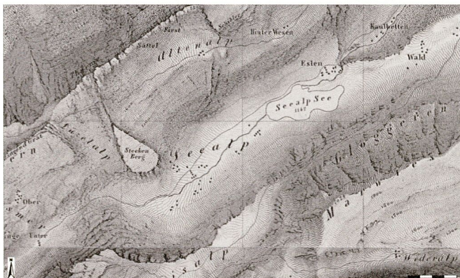
Seealp, Ausschnitt aus der Eschmannkarte, Blatt «Altstaetten», 1846.

Auf Ausschnitten der Eschmannkarte aus dem Jahre 1846 und dem Siegfriedatlas aus dem Jahre 1889 ist auf der Seealp eine grössere Anzahl Hütten eingezeichnet. Bei der Prospektion wurden allerdings viel mehr Hütten und Hüttengrundrisse