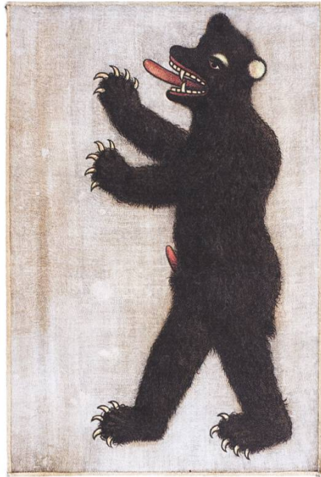
St. Galler Banner, 15. Jahrhundert (vor 1475), Leinwand bemalt. (Abb. 6)