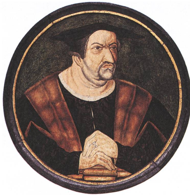
Joachim von Watt, Vadian (1483/84-1551), Bürgermeister, Arzt, Förderer der Reformation. (Abb. 8)

immer schwelenden wirtschaftlichen Streitpunkte nach Appenzell. Dort verlangte er auch die Bestrafung der Aufrührer und Verbreiter dieser Banner- und Urkundengeschichten, um das gute Einvernehmen von St. Gallen und Appenzell nicht weiter zu gefährden. Was Vadian verschwieg: St. Gallen erschwerte die Ausgangslage zusätzlich, indem die Stadt Waren von Güggi – dem oben erwähnten Gründer der Appenzeller Handelsgesellschaft – beschlagnahmte. 34