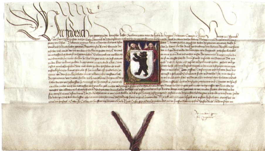
Der St. Galler Bär trägt seit 1475 ein goldenes Halsband. Wappenbesserung verliehen von Friedrich III. für St. Gallens Teilnahme an den Burgunderkriegen. (Abb. 7)