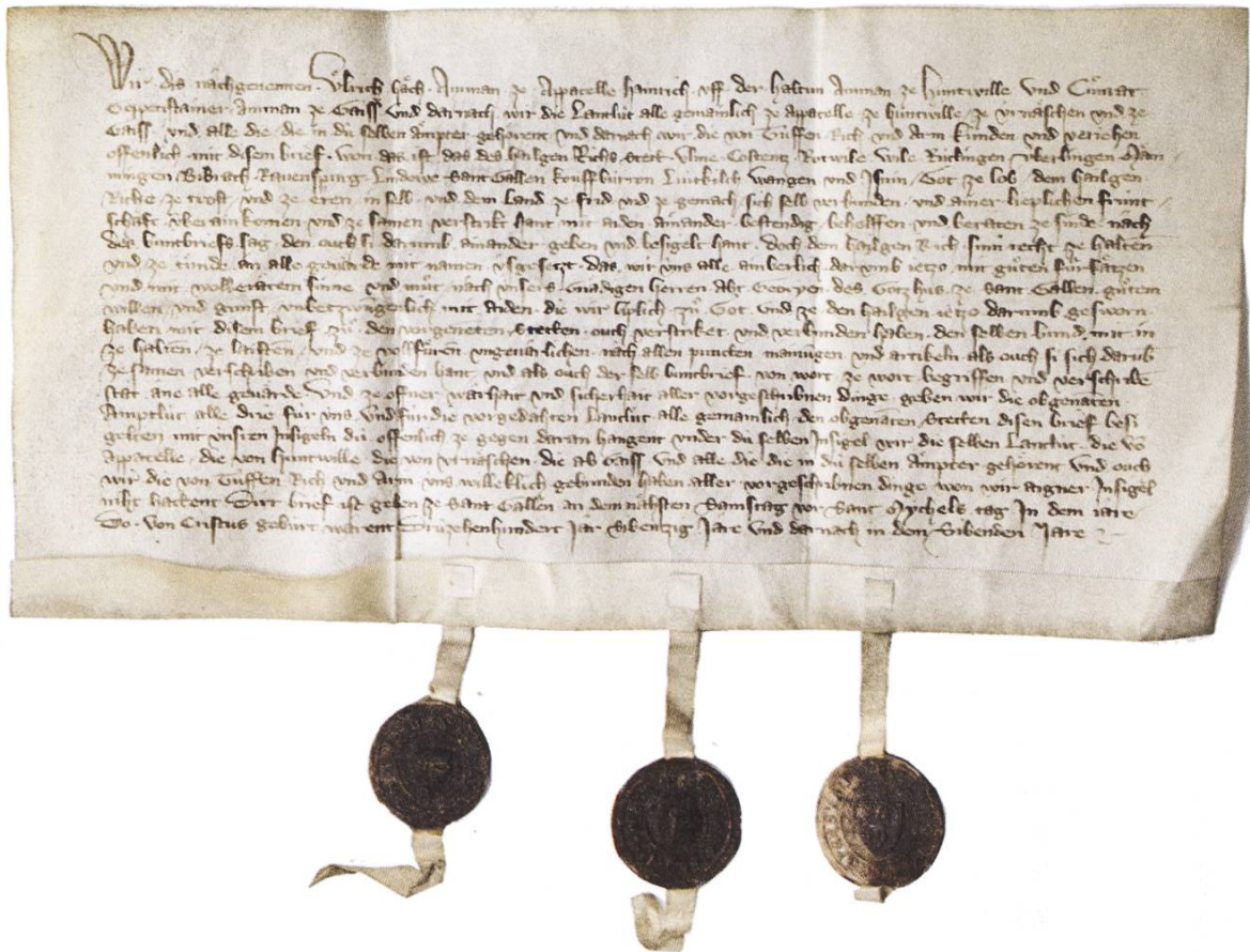
1377 wurde der Schwäbische Städtebund erweitert: Als erste Nichtstädte wurden die «Appenzeller lendlin» aufgenommen. (Abb. 2)