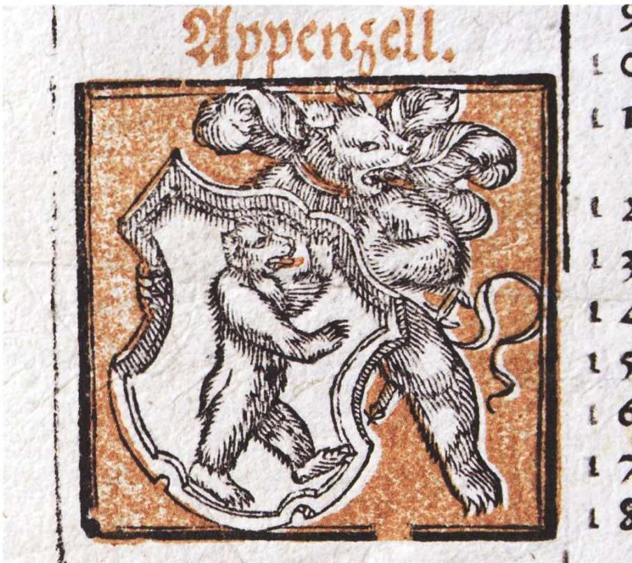
Das Wappen des Landes Appenzell im Kalender von Leonhard Straub. (Abb. 10)

verlieh sie doch ihren wirtschaftlichen Forderungen ausreichend Nachdruck. 43