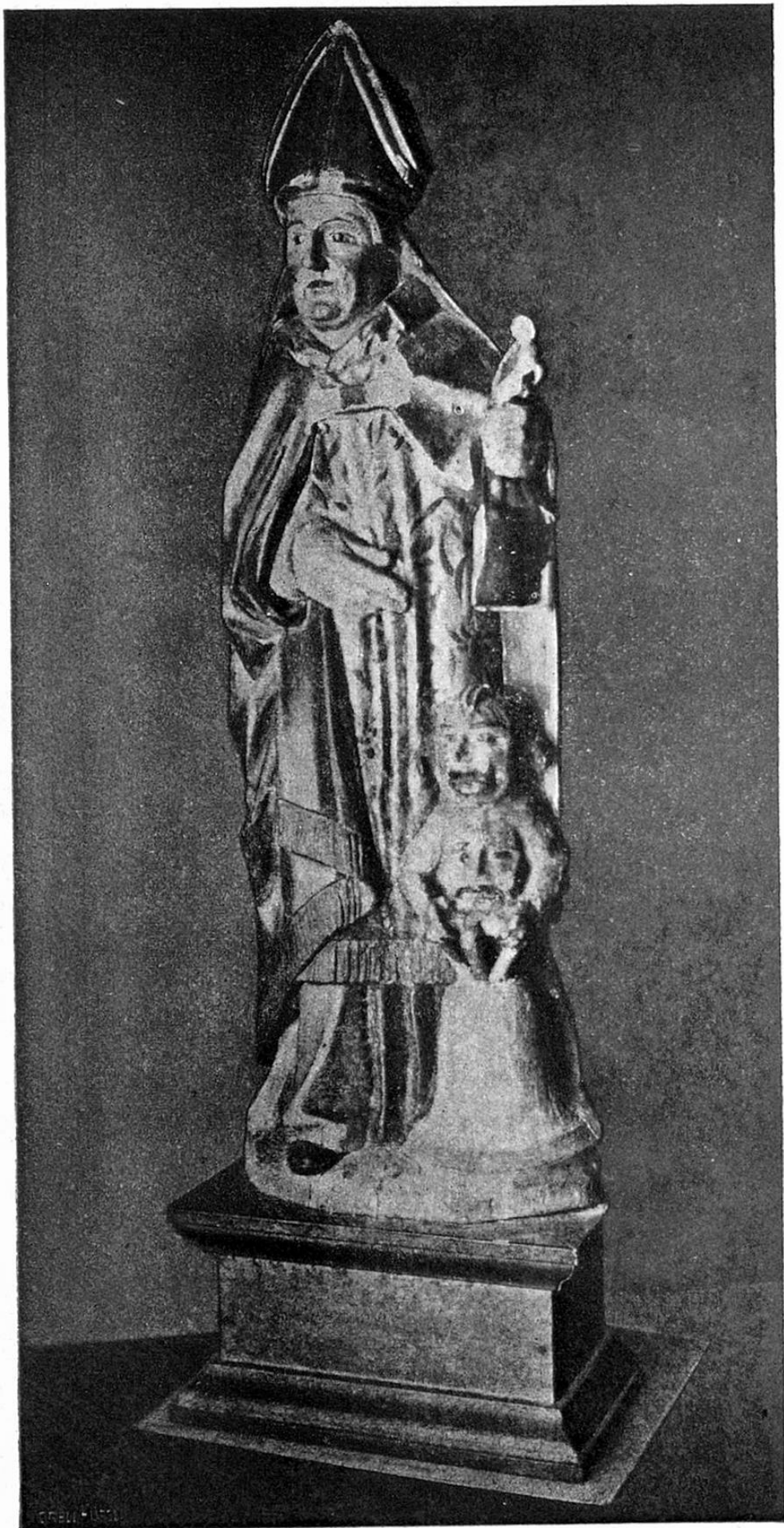
SOGN GIODER, statua gothica della claustra de Mustér.