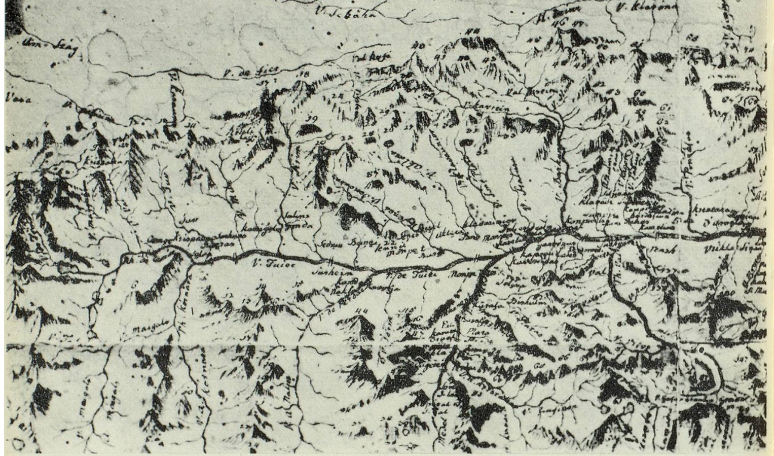
Carta geografica designada da P. P. a Spescha. Ella sesanfla el museum cultural-historic della claustra de Mustér. La carta representa la Cadi con la vallada dil Rein da Breil ensi, con la Val Lembra, Tumbiv, Val Punteglias (Ferrera), Val Barcuns ed ulteriuras vals al nord dil Rein de Sumvitg, Mustér e Tujetsch. Ferm marcadas ein: la Val Tenigia e la Val Medel. Sura, en scartira de Spescha, ils numbs de cuolms, vitgs e vals. — Mira Radioscola XI, 1966, 7.

29) Krap de bova 30) Salagronda 31) P. Trakbiat 32) S. Sopi 33) P. L. Ajgela 34) P. la krag 35) P. la alpa 36) P. Valpinca 37) P. Gioien 38) Kacoraula de Tuncin 39) Krap Klarina 40) P. Tuncin, el pla sul 41) Mor 42) P. Moseu 43) P. de Sluma 44) P. Jauer, u. Centlinar 45) Stigala 46) P. Srimis 47) S. de Sluma 48) P. de Placiu 49) P. barkua, polen 50) Gripi, gron 51) Kariotragron 52) Kariotragron, u. P. de Sluma 53) P. Tuncin 54) P. de Sluma 55) P. de Sluma 56) P. de Sluma 57) P. de Sluma 58) P. de Sluma 59) P. de Sluma 60) P. de Sluma 61) P. de Sluma 62) P. de Sluma 63) P. de Sluma 64) P. de Sluma 65) P. de Sluma 66) P. de Sluma 67) P. de Sluma 68) P. de Sluma 69) P. de Sluma 70) P. de Sluma 71) P. de Sluma 72) P. de Sluma 73) P. de Sluma 74) P. de Sluma 75) P. de Sluma 76) P. de Sluma 77) P. de Sluma 78) P. de Sluma 79) P. de Sluma 80) P. de Sluma 81) P. de Sluma 82) P. de Sluma 83) P. de Sluma 84) P. de Sluma 85) P. de Sluma 86) P. de Sluma 87) P. de Sluma 88) P. de Sluma 89) P. de Sluma 90) P. de Sluma 91) P. de Sluma 92) P. de Sluma 93) P. de Sluma 94) P. de Sluma 95) P. de Sluma 96) P. de Sluma 97) P. de Sluma 98) P. de Sluma 99) P. de Sluma 100) P. de Sluma