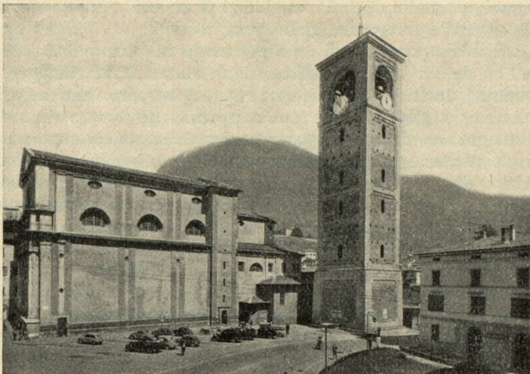
La «Collegiata», baselgia parochiala de Sondrio. (Dagl Ischi 49, 1963)