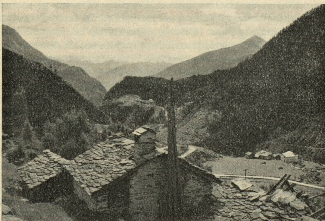
Egliada d'entadem la Val Malenco enviers Sondrio el sid.