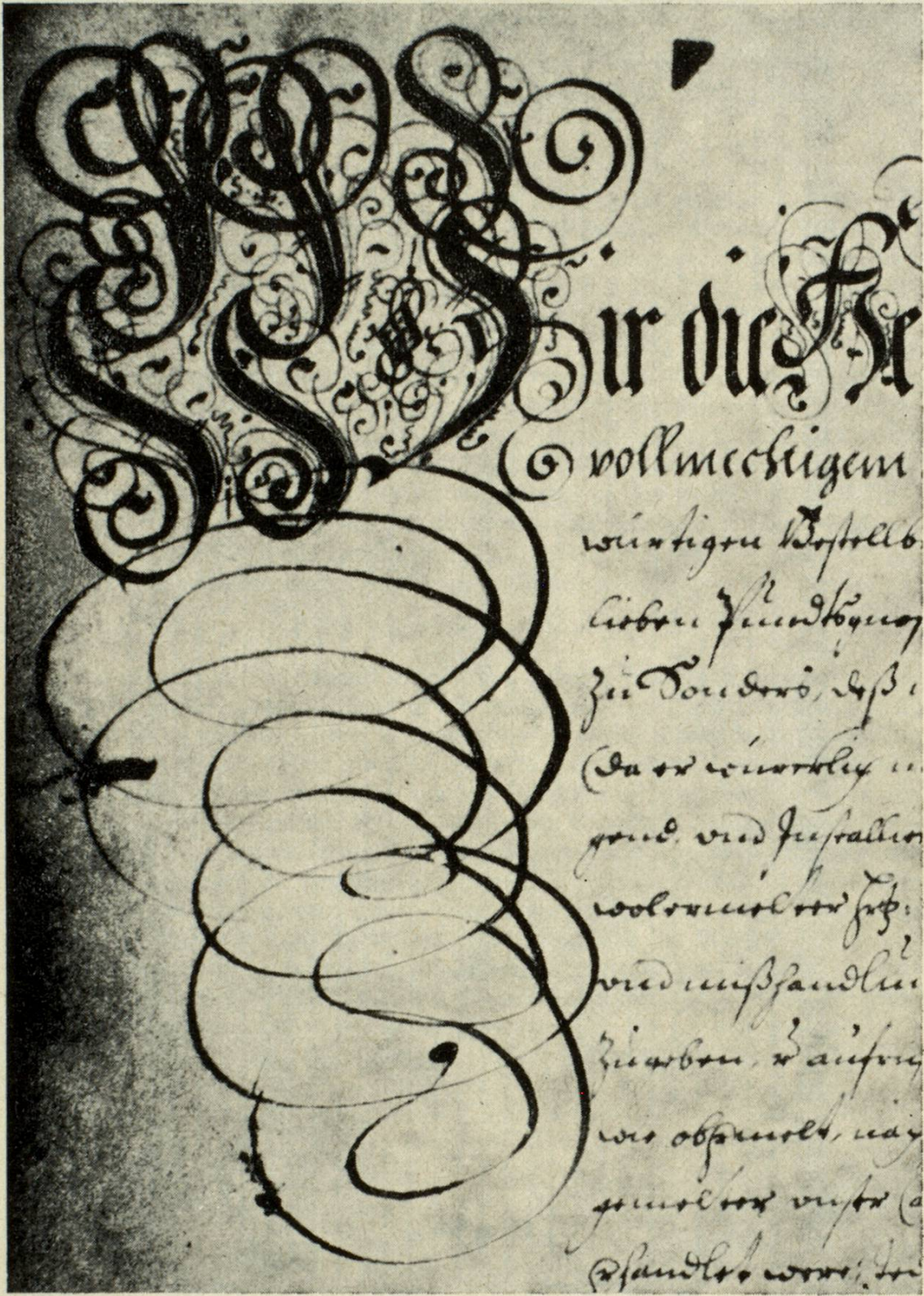
Tgau della sura brev d'ordonanza en grondezia naturala cun la pompusa iniciala.