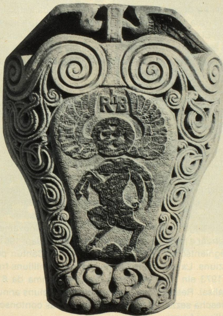
Emblem dalla Viafier retica che sesanfla sur l'entrada principala dil baghetg d'administraziun a Cuera.

Quellas obligaziuns fundamentalas ed il sistem tecnic dattan allas viafier la tempra d'interpresas cun aults cuosts fixes. Quei vul dir ch'ils cuosts ein per la gronda part caschunai per motivs publics e ch'els vegnan mo per pintga part influenzai entras il consum. Igl urari sto vegnir risguardaus ed il cuors purschius di per di, era sche las frequenzas da singuls trens ein schliatas, aschia che las entradas pon gnanc curclar ils cuosts variabels! Quei ei in motiv principal digl equiliber disturbau el tenercasa viafieril aschi ditg ch'il consumant da prestaziuns da transport sa eleger libramain il vehichel. Havend las interpresas da viafier expensas per personal che muntan a pli che 60% dallas expensas totalas, caschuna plinavon l'inflaziun progressonta d'ozildi gronds cuosts supplementars. Da l'autra vart han ins – per motivs politics e conjuncturals – buca astgau adattar