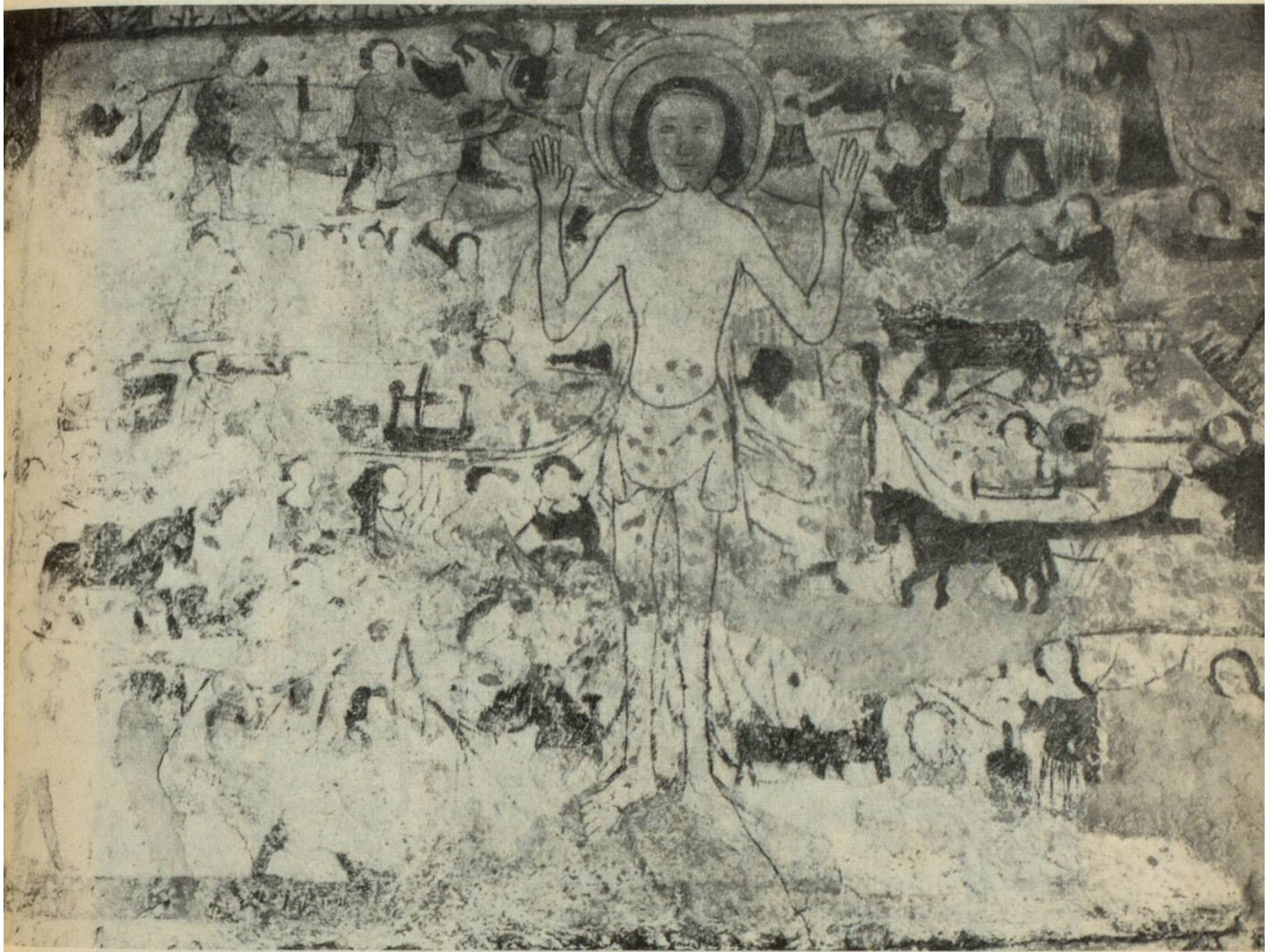
Maletg vid il mir della tuor-baselgia a Schlans.