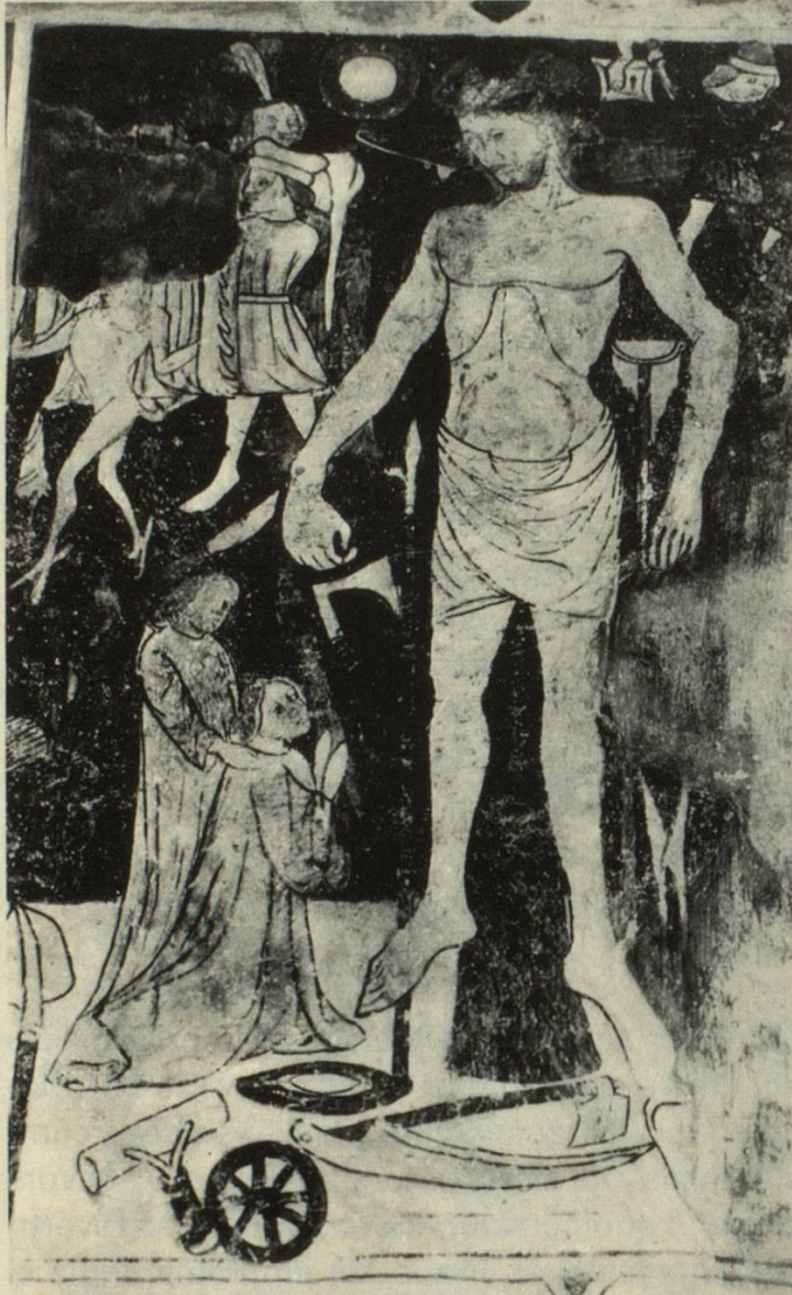
Maletg ella baselgia de Vuorz.

Ei dat denton in exempel ella vischinonza che muossa che la capientscha per la representaziun era ida a piarder. A Breil han ins discuvretg in maletg ella baselgia de s. Martin, ina pictura murala ch'ei vegnida scaffida pér all'entschatta dil 16avel tschentaner. Enamiez utensils e figuras de mistergners stat buca Cristus, mobein la figura d'ina femna che vegn interpretada sco Maria Madleina. 4 Cun la megliaera bunaveglia san ins buca anflar in senn en quella cumposiziun. Ins declara ei aschia ch'il pictur de Breil hagi vuliu imitar il maletg ella baselgia de Schlans ed hagi buca capiu el pli.