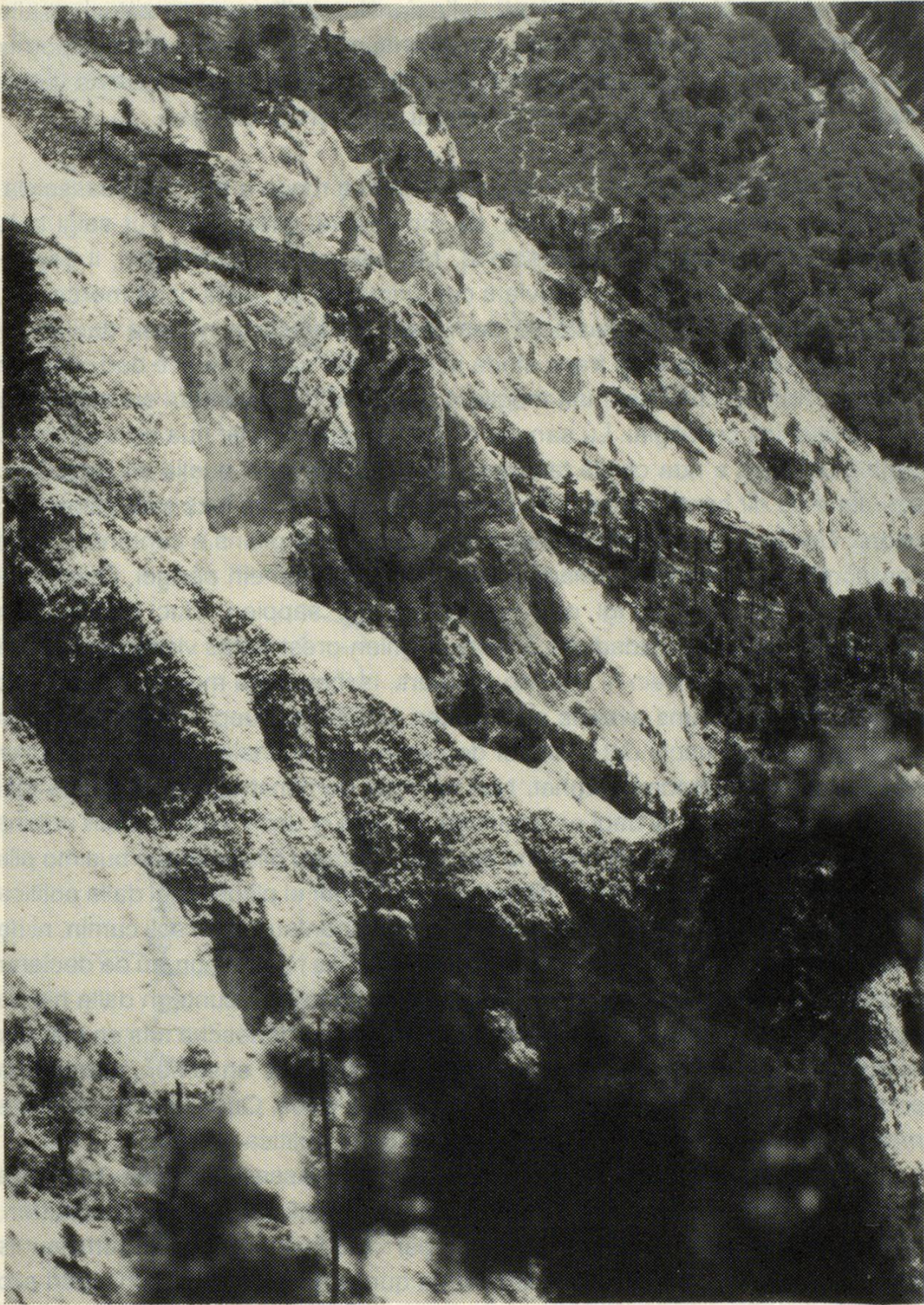
Ina part dalla Ruinaulta – Ruina e restonza dad in mund che ei sfundraus a val