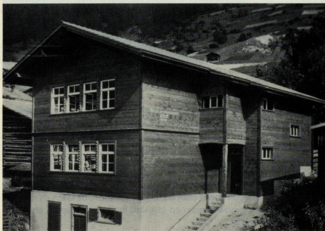
La casa da scola professionala a Cumpadials 1942–1971