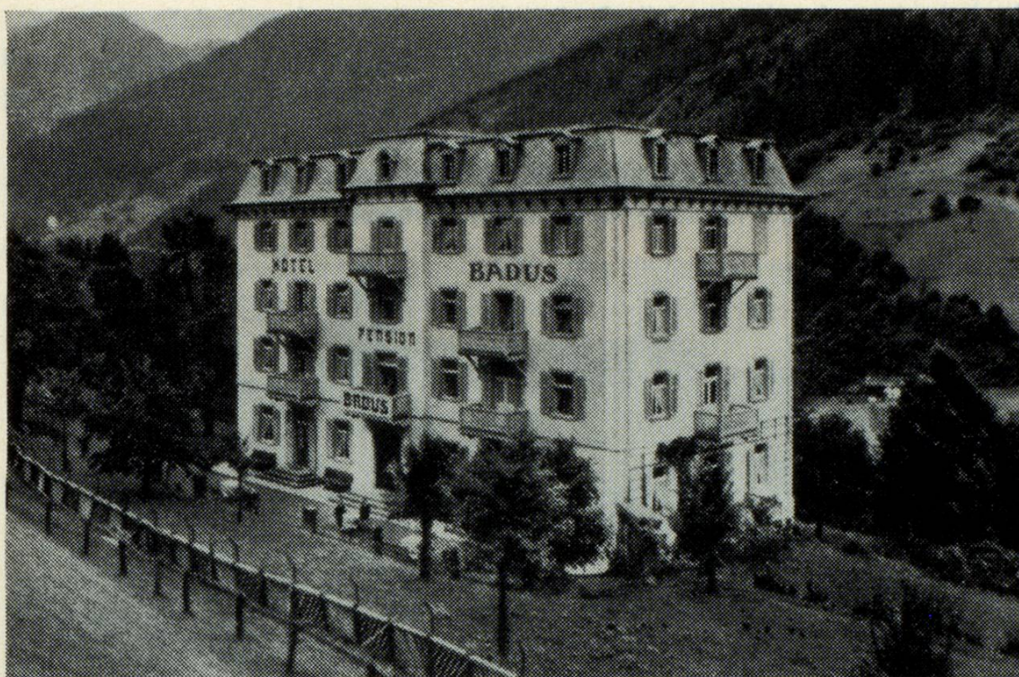
Hotel Badus, Cumpadials, scola professionala Cadi 1932–1942, ussa Casa s. Giusep Cumpadials