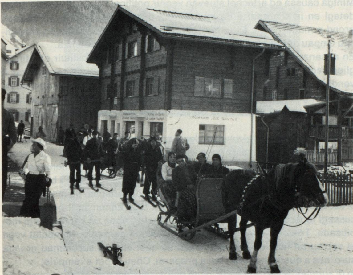
L'empresca casa dil Consum liber a Sedrun construida 1933

Dapi 1933 ha la societad silmeins ina atgna casa da fatschenta. Damai ch'ins ha stuiu serestrenscher cun il sulom, ha ei giu num far quen cun mintga cantun dil baghetg. Igl empren ei vegniu mussau a mi las localitads e nua che tut las raubas eran deponidas e cavegliadas. Haiel stuiu constatar ch'il plaz era scarts, mo ei basegna saver seolver e sedrizzar leusunter. Per frinas, uaffens dil funs etc., fuva in magasin en in local privat ual dasperas a disposiziun.