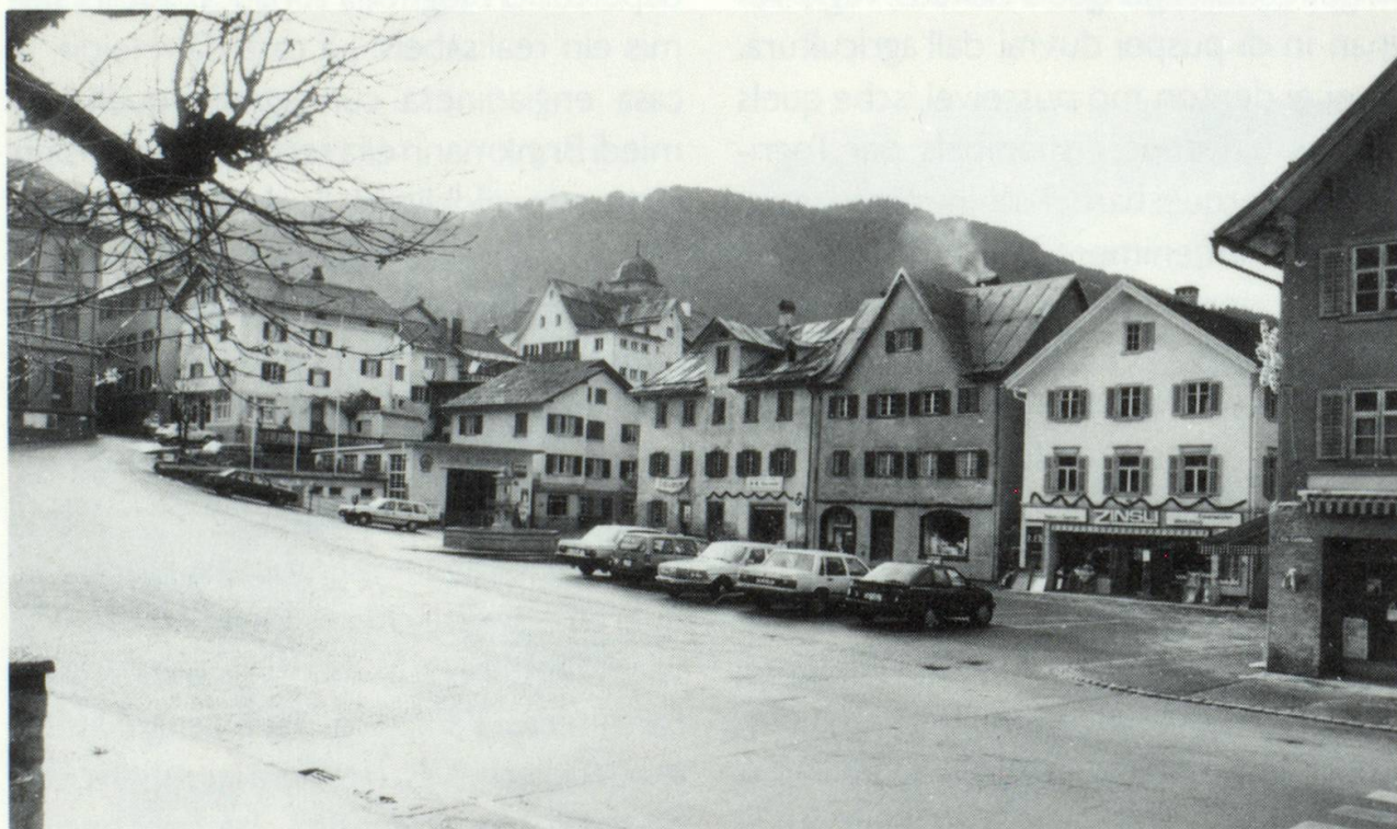
Las biaras da quellas casas entuorn la piazza cumin da Glion duein vegnir destruidas, malgrad ch'ellas ein da valeta historica e ch'ina renovaziun fuss pusseivla. La Protecziun dalla patria pretenda silmeins ina concorrenza architectonica.

Mintgin viva per sesez, siu siemi, sia libertad. Il spért da communitad che regia els centers dils vitgs vegls ei buca d'anflar cheu, malgrad il lenn, ils tetgs da crap e la pignola plantada en curtgin. Da cuort ha in construido da casas da vacanzas fatg ina concorrenza architectonica a Laax. Talas concorrenzas architectonicas stuessen las vischnauncas promover, per surbaghegiadas pli grondas schizun pretender. Fuormas architectonicas ston vegnir sviluppadas continuadamein. Da punct da vesta dalla protecziun dalla patria ein habitaziuns da vacanzas denton da principi problematicas. Quartiers da vacanzas che serasan als urs dil vitg viado en la cuntrada portan magari als indigens difficultads d'identificaziun.