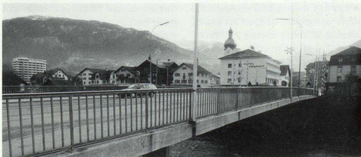
La destrucziun dalla punt veglia, in segn caracteristic dil marcau, ei stada l'entschatta d'ina midada rapida dil vegl maletg dil marcau.

ner, casas da confecziun e seria e hotels sco ualers ni chalets surdimensiunai. Exempels: Tujetsch, Mustér, Falera, Laax, Flem. In cass per sesez ei Glion, igl emprem marcau sper il Rein. Lez han ei entschiet a reveder da rudien ils davos onns, buca per avantatg dil maletg dil marcau.