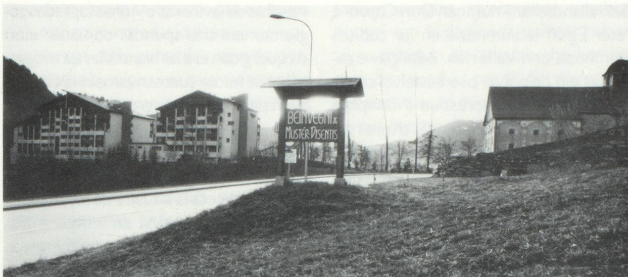
La carta da viseta da Mustér.

cun casas dils davos decennis, beinmantenidas, renovadas, ornadas cun flurs e circumdadas dad Orts beinzerclai. Exempels: Rabius e Trun. Vitgs turistics cun ina architectura tipica per allogis da vacanzas, che sedifferenzieschan strusch da tals el Tirol dil sid, en la Surselva bernesa ni egl Uaul