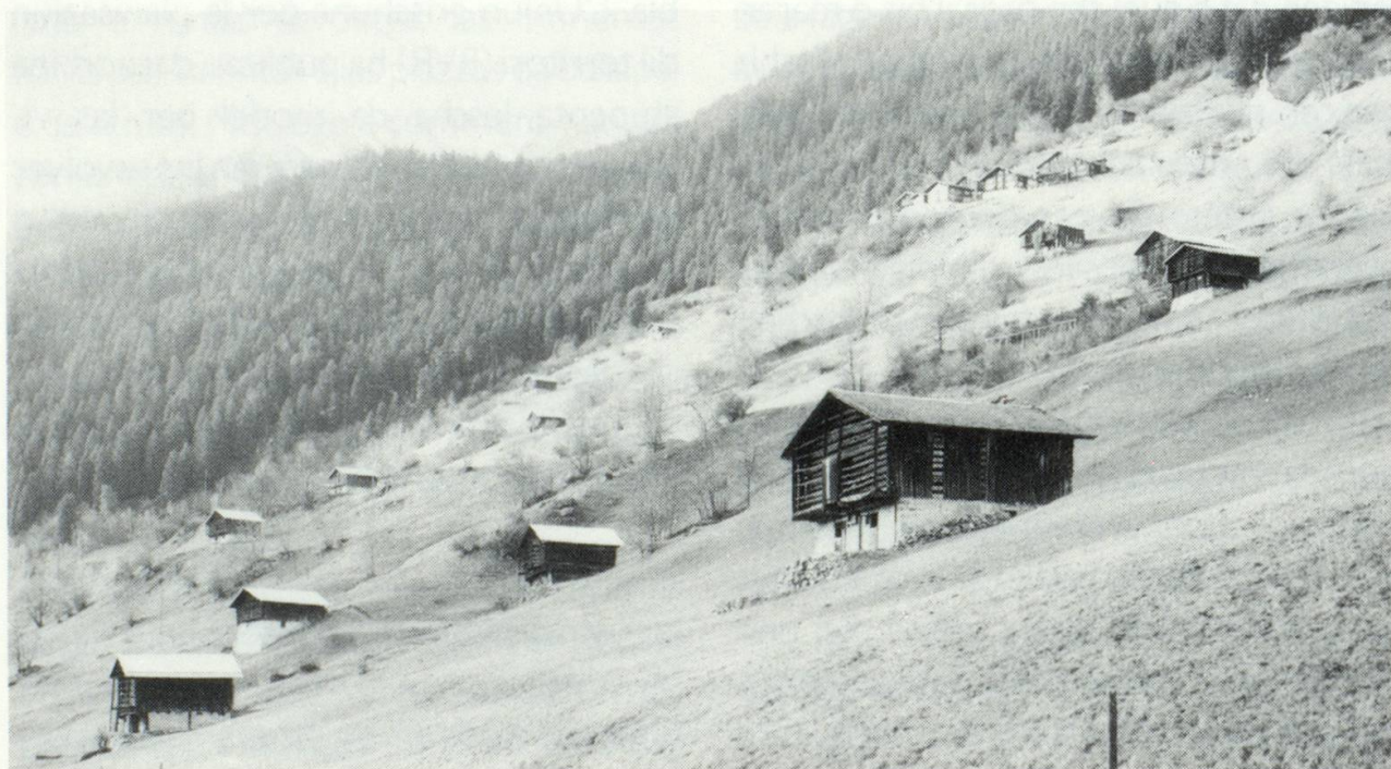
Clavadi, in uclaun intact. Ils biars clavaus en las spundas suleglivas ein cultura tradiziunala sursilvana che sto vegnir mantenida.

Quei ch'ins vuless contonscher: ch'ils clavaus vegls vegnessen utilisai dapli per l'agricultura moderna. La protecziun dalla patria recamonda d'inventarisar tut ils baghetgs da menaschi agrars, d'analisar lur diever present e futur e sin fundament da quellas enconuschientschas orientar ils possessurs. En scadin cass astgan clavaus ordeifer la zona da baghegiar buca vegnir