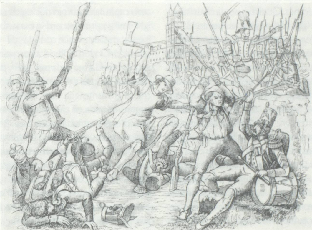
L'attacca purila a Mustér.

scha, auters tschontschan da 400 tochen 800 morts). Als Austriacs mauncan 20, als Grischuns 13 umens. «Suenter haver dau il schlacht» 24 vegnan ils blessai transportai en claustra e fleghiai da pader Placi à Spescha. Ed il chor giubilont da Muoth tila ils fols: «Sco von temps ils vegls Grischuns. Fegls vengonzs de bravs babuns, vein nus oz victorisau, nossa patria liberau, . . .» 25