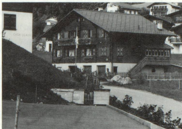
Quei che plai ei quei ch'ins vesa savens.

las femnas ein pli sensibilisadas sin quei sector ch'ils umens.