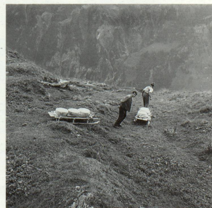
EB, Val Sogn Pieder

In buob davon ed in davos. Enamiez la vacca sut il giuv: tut quei per ina carga roma. Quel ch'empela il bov aulza il tgau e surri egl apparat. El ha temps. Il temps para de star eri. Ual sco la menadira. Aber ella semova. Omisdus buobs passan ual sil pei senierster ed aulzan il dretg per far in pass anavon. Era la vacca semuenta en quei tact, sia umbriva tradescha ella, aber aschi plaun ch'igl empalader sto buca ver tema de vegnir suten. El aulza il tgau e surri egl apparat. Ei han temps. Tgi che va cun ina carga roma sa buca haver prescha. El stretg spazi de quella veta muntagnarda ha il temps lartg e bien. Sin nossas vias ladas cun lur menadiras spertas ha el buca plaz pli. Il temps vegn laguttius dalla prescha. Sco sch'el fuss enta peis a nus «fagein nus ir» il temps, ed aschia eis el negliu perpeis pli. Quels buobs han lur tec roma che smarschescha els uauls, ed il temps va en melli scalgias en nossas olmas.