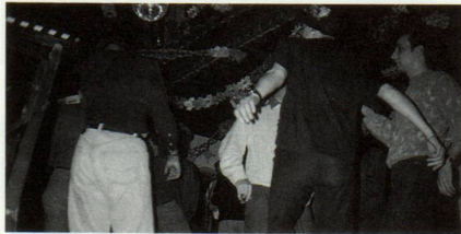
... ils indigens saultan sco ei s'auda ...