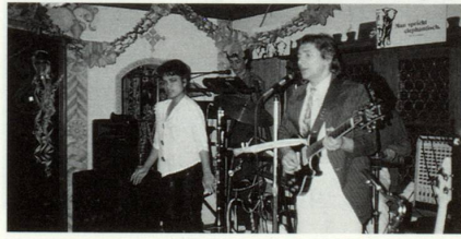
... negins happenings romontschs ...

Tut las bars han enzatgei communabel: ina meisa aulta, silla quala ins survescha e venda bubrondas ni outra rauba. Ina bar da bubrondas ei en emprema lingia in liug social, nua che la glied s'entaupa e discuora in cun l'auter sur da tut pusseivel e nunpusseivel. Ina bar ei era in liug, nua che la glied ruaussa dil stress da mintgadi, nua ch'ella buenta ils quitaus e las temas egl alcohol, nua ch'ella meditescha e filosofescha sur dalla veta en special ed en general, nua ch'ella fa propiests e plans, nua ch'ella dat la bucca, sevilenta e selamenta, nua ch'ella ri, bragia e s'inamurescha. Ina bar tipica cudezza adina in tec ils senns ed ils sentiments e scaffescha in mund d'illusions. Ils spiaghels che duplicheschan personas ed objects dattan in sentiment da vastadad. La glisch brausla e la colur stgira digl indrez creeschon ina cert'intimitad ed anonimitad. Las differentas colurs dallas cazzolas e la musica sluccan las monotonias dalla veta. Leu nua ch'ei dat cazzolas, sutgas, canapès cotschens e camerieras vestgidas mo cun in pèr scrotas seregheglia l'energia erotica — sut circumstanzas.