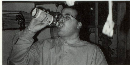
... barman: semess en posa spontanamein ...

ault, in propeller che gira, dapertut spaghels, retschas da butteglas cul culiez engiu, ina massa glasa sin crunas da veider, in immens zeiver cun glatscha, butteglas da schampagn che senodan, ina liunga bar da marmel stgir, vuschs, levzas che tilan vid cigaretas, fils da fem che sesaulzan, tschenders, buccas che beiban gervosa, migeuls miez vits, il barman en camischa alva, caltschas nerass, il tun da glatscha che croda sin veider, las survintschevias dil barman sesaulzan, in martini alv cun pauc sifon, duas stangas, moviments da rutina, ils hosps stattan sin peis, sepusan vid la bar ni sesan sin sutgas aultas, discussiuns da mintgadi, filosofias dalla veta. . . . La descripziun d'ina bar tipica savess era esser outra. Ei dat numnadamein biaras sorts da bars: la bar d'expresso sco ins anfla ell'Italia, la bar el stil engles numnada pub (per public house), la bar da piano, la bar da snack, la bar da latg, la bar da glatsch sut tschiel aviert ch'ei dat era tier nus e.a.v. El vast senn dil plaid s'audan era il local da notg, il dancing e la discoteca tier las bars, plinavon dat ei bars en casas privatas, bars da calzers, bars da caltscheuls e bars da plattas da grammofon.