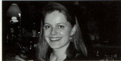
... barmaid: lavur mo durant la stagiun ...

Il prototip d'ina bar: illuminaziun fluore-scenta cun letras extraordinarias «bar x», porta da glas, aria pesonta, plantschiu