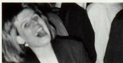
... in mund d'illusions ...

buca vegnan era serradas (p.ex. han ils responsabels dalla Uto AG a Turitg ponderau da serrar la «Placi-Bar» dil Disentserhof a Mustér). Bars che muossan ch'ei dat era tier nus problems socials, q.v.d. cun drogas, vegnan serradas e buca pli aviartas (p.ex. «La Treglia» a Mustér). Sch'ina nova bar vegn insumma aunc aviarta, lu ha ella u enzatgei d'ina bar da yuppies (p.ex. il «Postigliun» sper la banca dall'UBS(!) a Mustér) ni ch'ella ei mo ina pseudo-bar da glatsch che liua la primavera (las schinumadas «Eisbar» sut tschiel aviert ch'ei in ussa en moda).