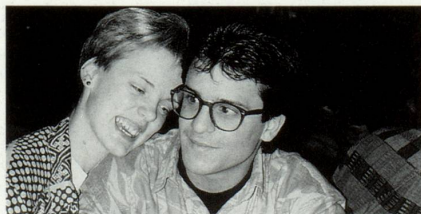
... in tec malsegirs ...