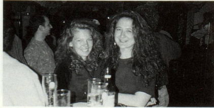
... spetgel entochen ch'jeu anfel igl um per la veta ...