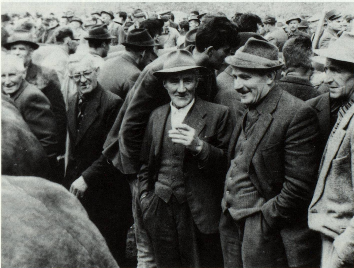
In ambient preferiu: Il specialist el center denter bia gliued ad exposiziuns da biestga

Basta cun quei vess jeu; jeu vess aunc giu, liu risdar enzatgei sur da quei ch'jeu erel cun, ch'jeu erel aunc fumegl cun quei pur cheu a Lumbrein. E quei che plascheva a mi il meglier, cura ch'jeu erel cun quei pur, era igl unviern cu nus eran sin quels cuolms e pervesevan. La sera gnevan nus lu ensemen e fagevan empau legher e devan empau jass e risdavan si da quei e risdavan si da tschei. Basta, ina sera ei lu era in vischin gnus lu era tier mei a vitg e sche ha el lu era entschiet risdar: ier sera hagi el giu propi in curios cass. El vevi ... la caussa era ida schia, gie: el eri ius si quella sera a perver, sco el scheva e pervesiu tochen tier il mulscher e lu per sesez veva el quels vadials e la galeida vevi el giu mess en sut letg. E lu cura che el ha giu da mulscher, eis 6 el lu tunschiu en per la galeida e grad pegliu ella miarda da gat.