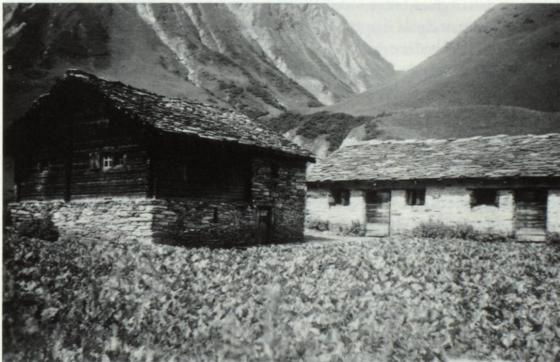
Las stallas da Blengias Sut, 1946

Bucatonmeins arrivan quellas dispetas era neu dil fatg ch'ils dretgs d'alp eran da gliez temps dètg cavistrai. La plipart dils proprietaris d'alps vevan, entras la cumpra da terren, aunc survegniu gratuitamein in adossament da dretgs specials da tuttas sorts. Enconuschents fuvan denter auter: il dretg da buentar e da passadi, ils dretgs da pascular avon la cargada ni suenter la scargada, il dretg da lenna, il dretg d'untgida sco era la prescripziun da pagar certas contribuziuns dallas alps alla baselgia ed als paupers. En connex cull'alp Blengias era ed ei cunzun il dretg d'untgida da gronda impurtonza. Ils Aquilès duvravan per lur viadi ell'alp dus dis. En cass da nevadas ni malauras possedevan els il dretg d'untgida sin ina pastira dils da Vanescha (la Rofna).