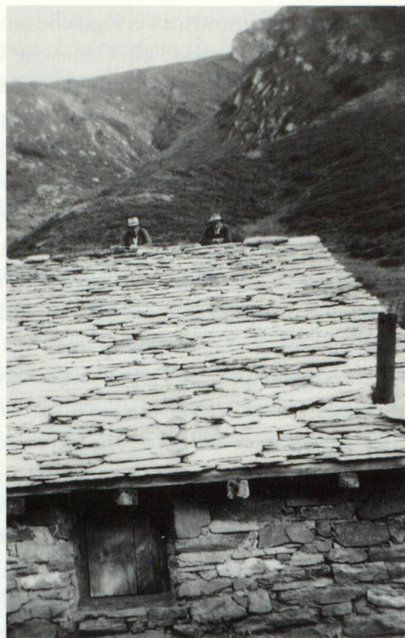
Blengias Miez, 1949