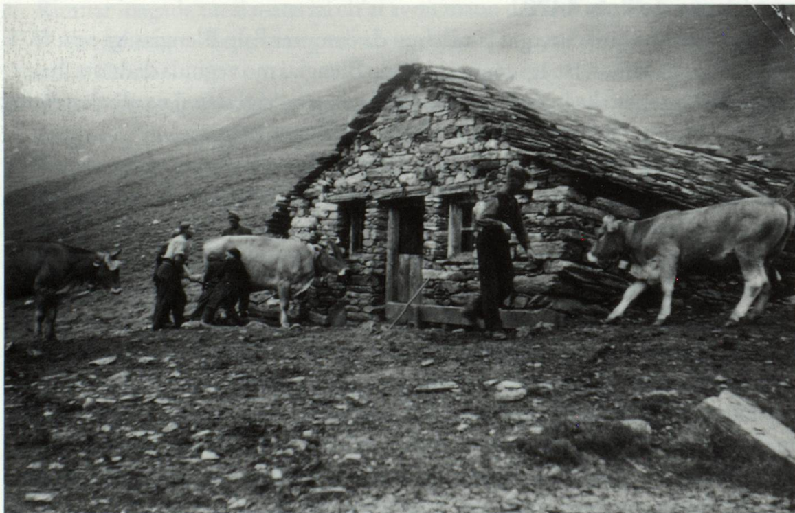
Blengias Sura, 1946

El 15avel tschentaner dat ei entginas dispetas denter ils vischins da Semione ed Aquila. Il cussegl dalla val Lumnezia sto intermediar in'emprema gada 1473 denter las duas vischnauncas. Igl interess per territori el Grischun era daventaus gronds. Il motiv dalla carplina ei l'alp Blengias. La partida da Semione cumpra en consequenza la mesadad dallas brevs da pègn: l'alp e las duas tegias vegnan partidas si denter las duas vischnauncas. Plinavon vegn era concludiu che neginas dallas partidas astgien far donns sil terren da l'auter e quei ni da primavera, stad ni d'atun.