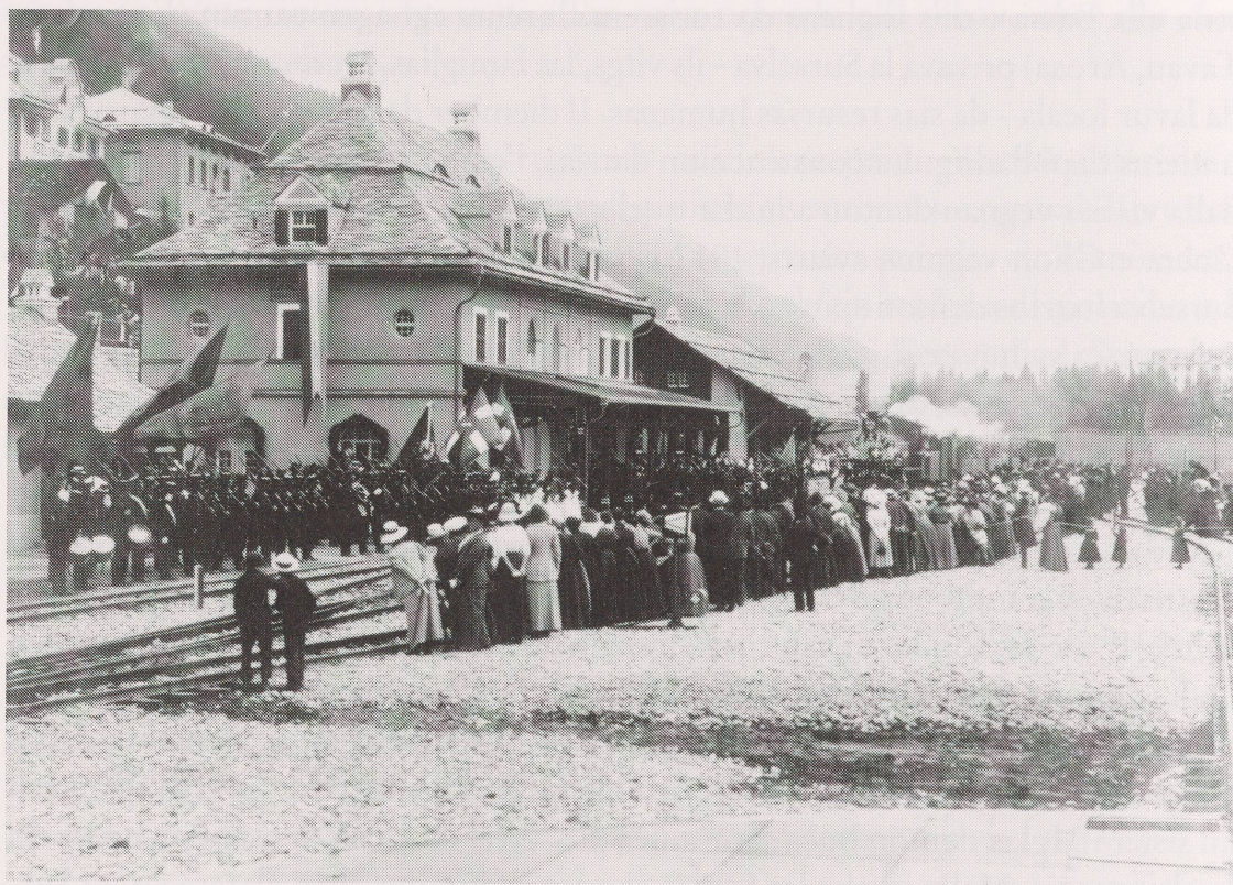
Emprem d'uost 1912: igl'emprem tren vegn beneventaus alla staziun da Mustér

Alla fin dil 19avel ed all'entschatta dil 20avel tschentaner ei la situaziun denton semidada marcantamein el sector da artisanadi e mistregn. Novas professiuns ein naschidas, ina part dallas veglias ei svanida. Cun la producziun da massa industrial e l'avertura da fatschentas da spediziun ha ei dau ina dira concorrenza. Ils