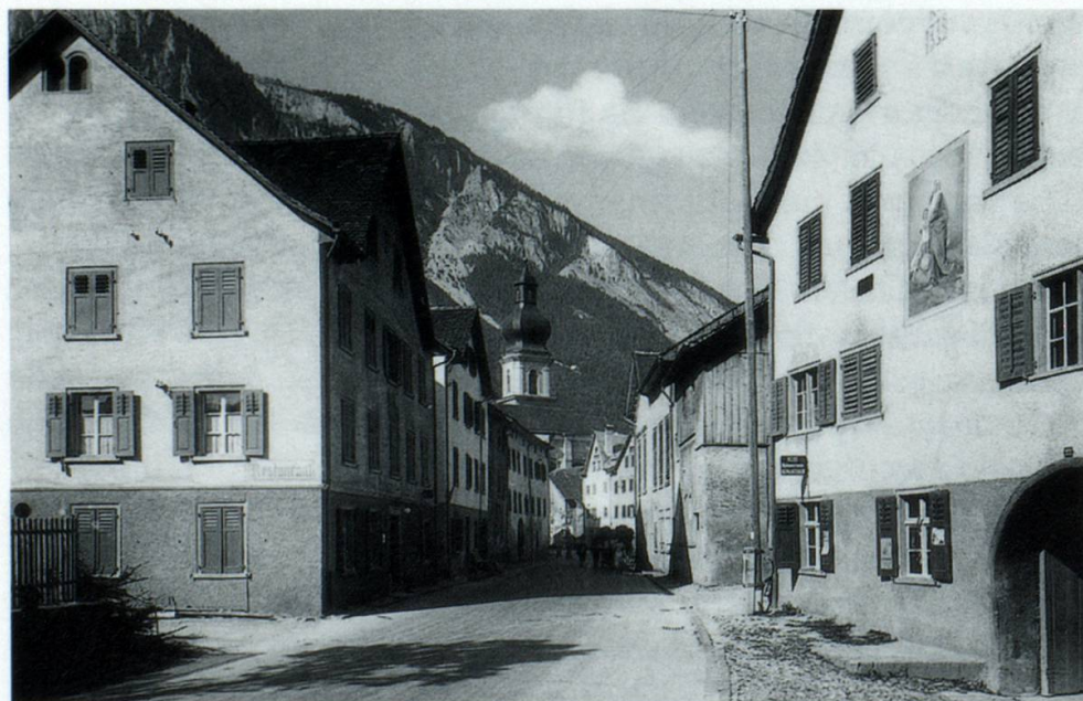
1939: Quella fotografia muossa la Gassa gronda naven dall'entschatta dalla Gassa surò en direcziun dil center. Quella part dalla Gassa gronda vegneva era numnada Gassa Sumvic ni Gassa sura .

Per indicar in tec pli exact in tschancun dalla Gassa gronda , discurravan ils indigens dad ina Gassa Sumvic [Sumvitg] ni Gassa sura