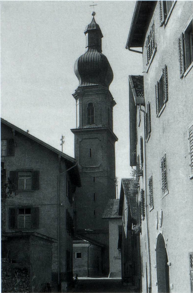
1962: La Via Baselgia contemplada naven dalla Gassa sutò. Davon la tuor havess la Streia plaz saviu sesanflar.