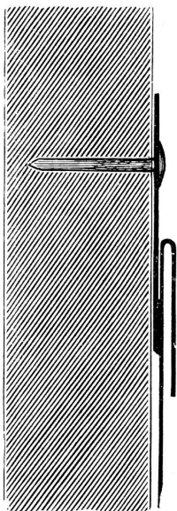
Natürliche Größe. Die oben an das Deckblech angelöthete, auf die Dachschalung genagelte Hasfte im Längenschnitt dargestellt.

Die bekannte New-Yorker Maschinenbau-Firma von R. Hoe u. Co. gibt im „Scientific American“ einige praktische