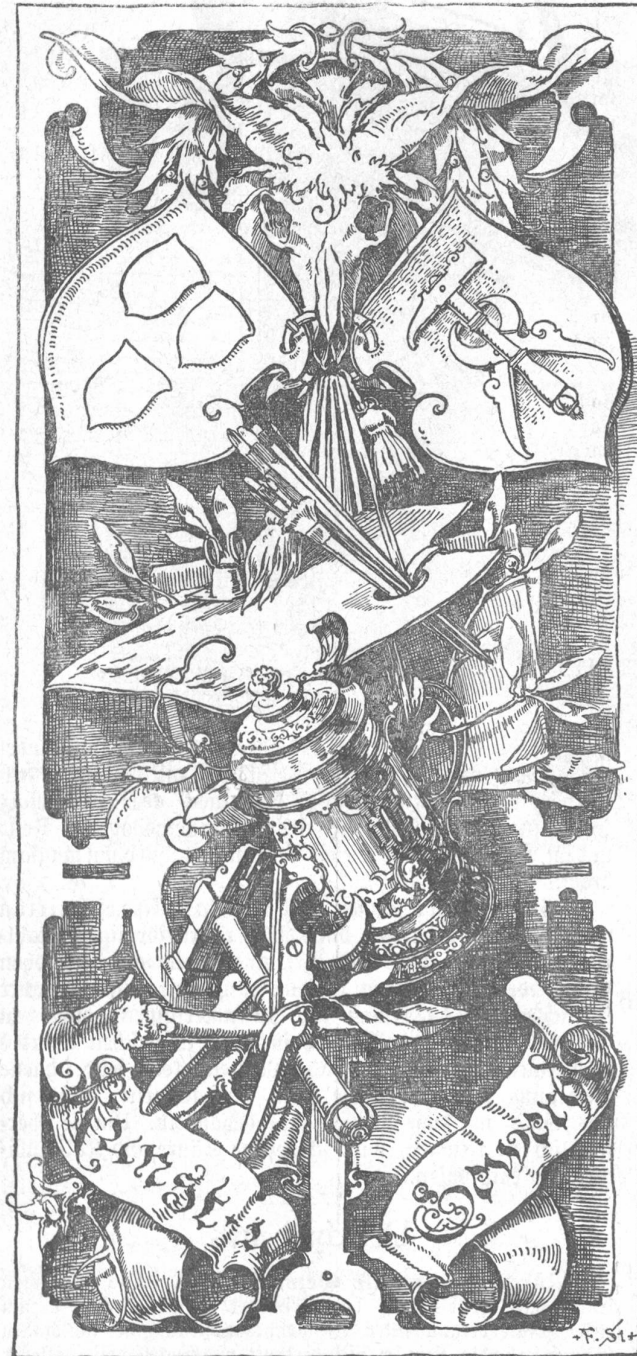
Aus dem Werke: „Allegorien und Embleme“ von Gerlach u. Schenk, Wien, Mariahilferstr. 51.

musiums, Architekt Müller und aus tüchtigen Handwerkern besteht, weist nämlich zum Verkauf angebotene Gegenstände zurück, die nicht geschmackvoll sind und normirt auf rationelle Weise auch die Preise, so daß man überzeugt sein darf, daß nur Preiswürdiges ausgestellt wird. Durch die Mitwirkung des Direktors des Gewerbemuseums wird den Handwerkern Gelegenheit geboten, mit dem Gewerbemuseum, wo so viel Mustergiltiges ausgestellt ist, in Fühlung zu bleiben. Ueberdies ladet die Prüfungskommission die Handwerker zu ihren Sitzungen ein und macht sie auf das aufmerksam, was ihnen noch fehlt, um ihren Geschmack und ihre Bildung zu heben.