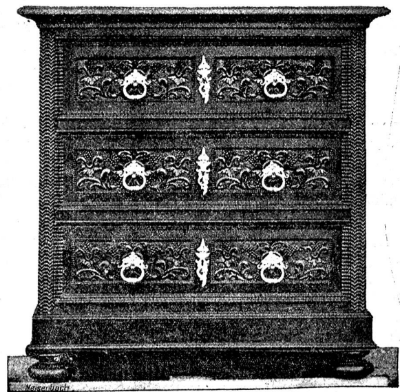
Kommode und Uhrgehäuse,

entworfen und ausgeführt von J. Dätwyler, Schreinermeister in Düringen.