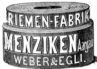
Medaille Genf. ———— Telephon.

Kernleder-Treibriemen in vorzüglicher Qualität verfertigt die 322