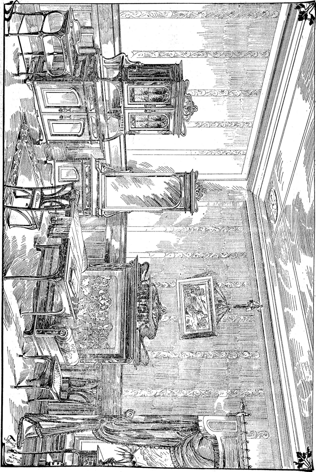
Stark verkleinerte Abbildung der Tafel 43. (Näheres wegen Raumangel in nächster Nr.)