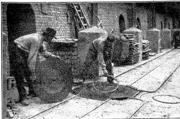
Fig. 1. Kletterdrehscheibe.

Diesem Mangel an einer geeigneten Drehscheibe wird durch eine neuerdings in den Handel gebrachte Erfindung abgeholfen. Es handelt sich hierbei um die in Abbildung 1 dargestellte verlegbare Kletterdrehscheibe