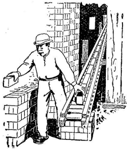
Fig. 3. Beförderung der Steine bei hohem Gefälle.

Durch die bisher gebräuchliche Art der Steinabladung wurden zumeist eine ganze Anzahl Hände in Bewegung gesetzt und gebraucht, wenn die Steine nicht unmittelbar neben den Wagen gestapelt wurden. — Durch die Rollbahn vereinfacht sich diese Arbeit ganz bedeutend, da stets nur zwei Leute nötig werden, bei beliebiger Entfernung