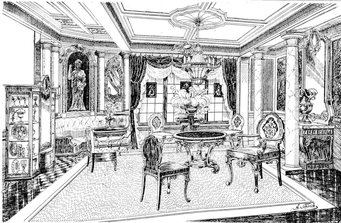
Empfangs-Zimmer und Salon nach einem Entwurf von Aug. Schirich, Architekt, Zürich S. Für einen Schweizer-Industriellen in China.

Der skizzierte Vorschlag mag auf den ersten Blick etwas umständlich erscheinen. Bei einfachen Verhältnissen und kleineren Abrechnungen wird er sich wesentlich vereinfachen und wenig Zeit in Anspruch nehmen; wo aber die Verhältnisse wirklich vielgestaltig sind und dazu noch eine große Bau Summe zu verteilen ist, darf sich eine Behörde schon die nötige Zeit nehmen, um eine möglichst gerechte und einwandfreie Kostenverteilung aufzustellen.