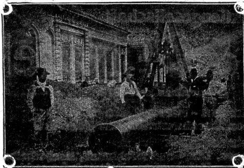
Verlegung überlapptgeschweisster Muffenrohre für die Wasserleitung von La Plata (Argentinien)