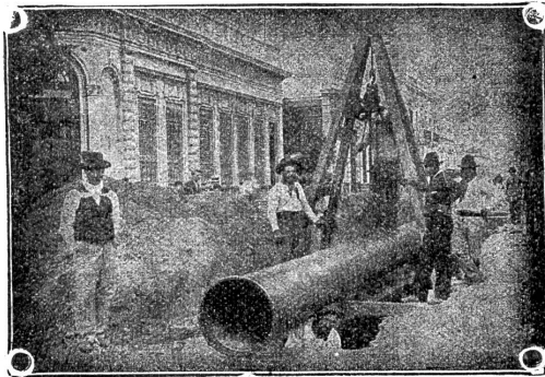
Verlegung überlapptgeschweisster Muffenrohre für die Wasserleitung von La Plata (Argentinien)