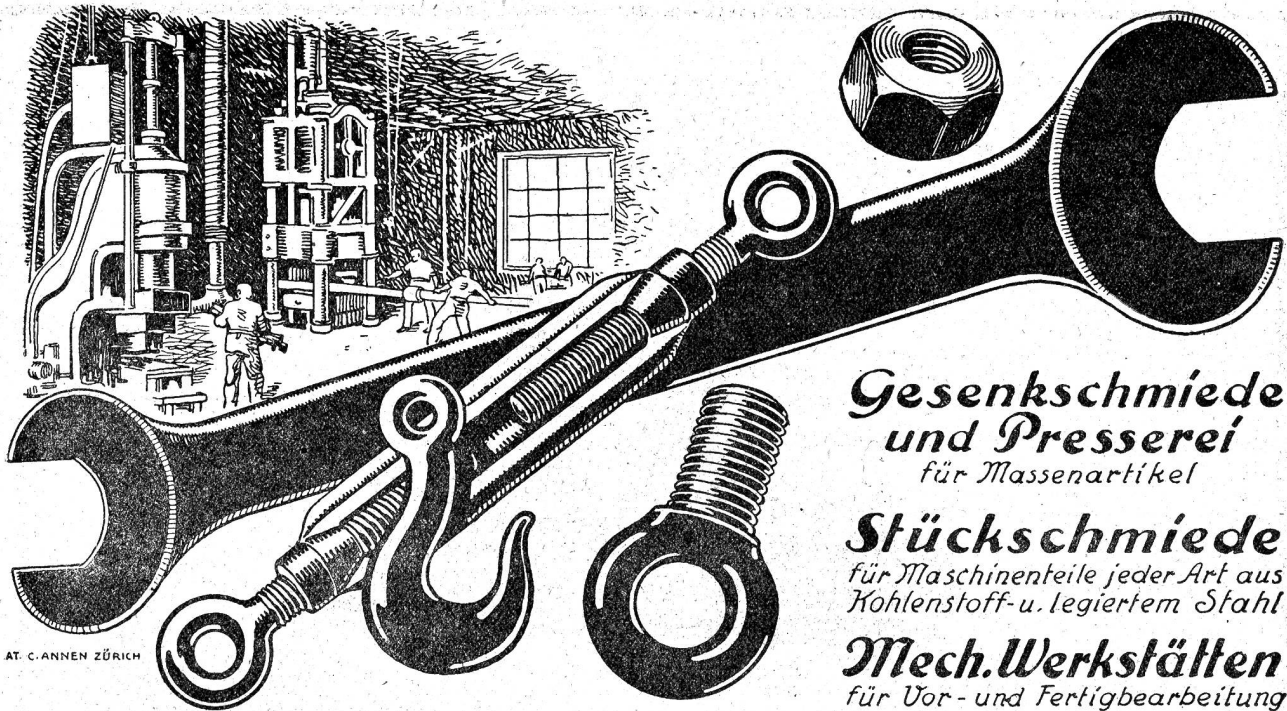
AT. C. ANNEN ZÜRICH

Gesenkschmiede und Presserei für Massenartikel