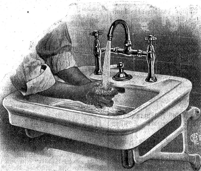
Abb. 7. Waschen in fließendem, temperiertem Wasser.

Eine befriedigende Lösung sei auch in der Frage der Unterbringung eines kleinen Bäckereibetriebes in der Gewerbeausstellung gefunden worden, während die Frage