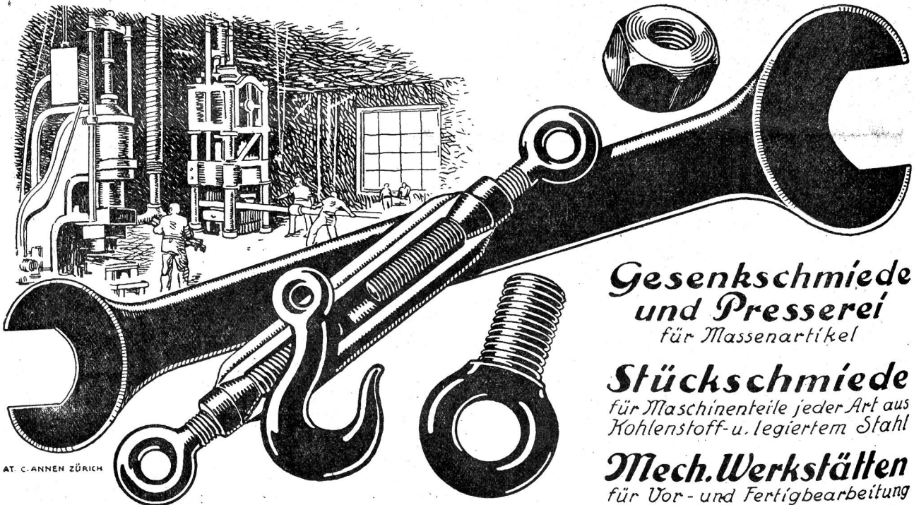
AT. C. ANNEN ZÜRICH

Gesenkschmiede und Presserei für Massenartikel