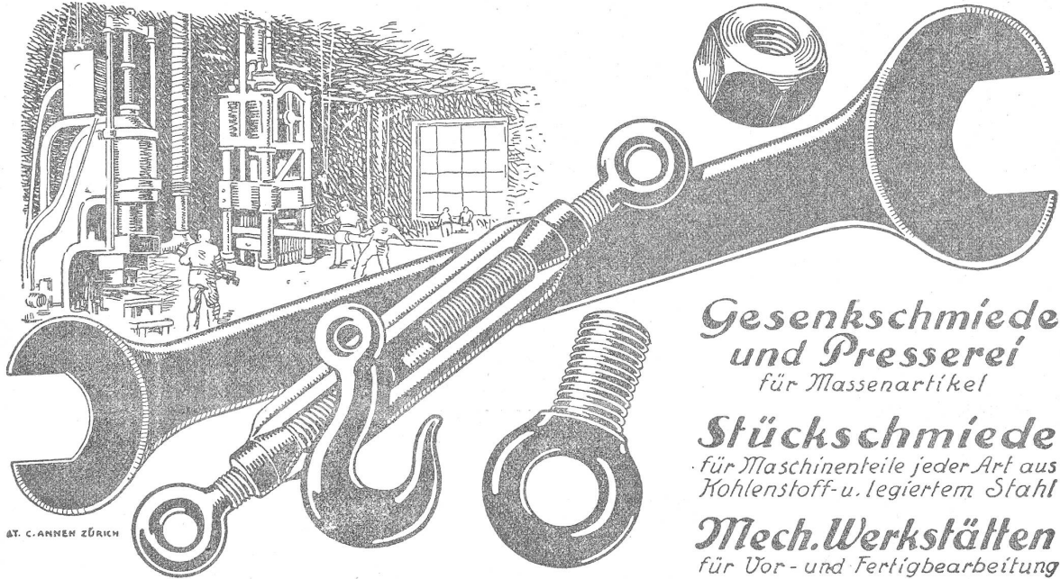
AT. C. ANHEN ZÜRICH

Gesenschniede und Presserei für Massenartikel